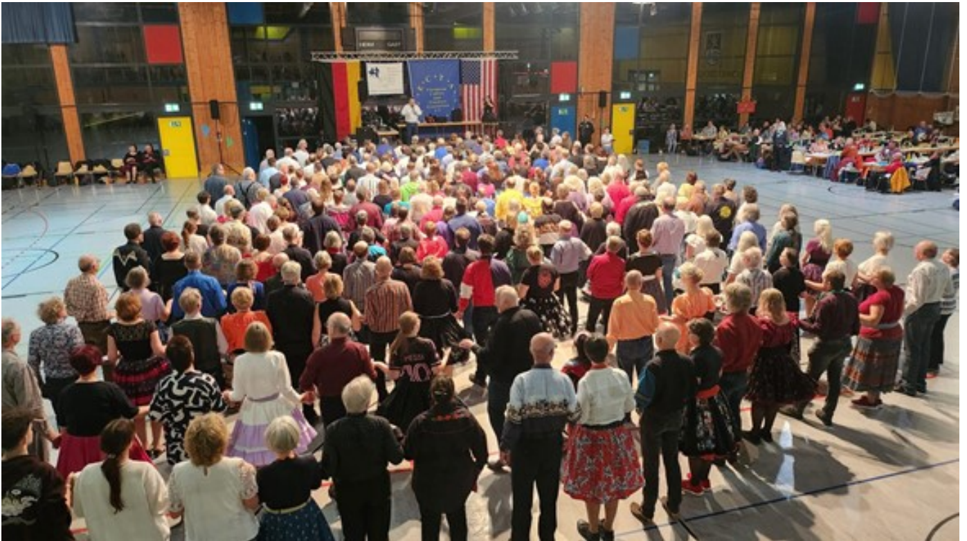
Aufstellung zum Grand March, Foto der Bavarian Stompers