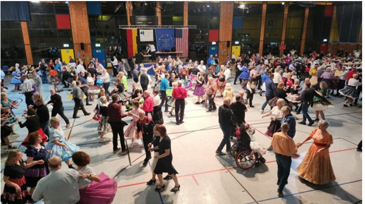
Samstagabend: alle tanzen zusammen.